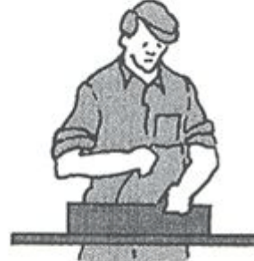
Svære arbejde Uegnet til siddende stilling